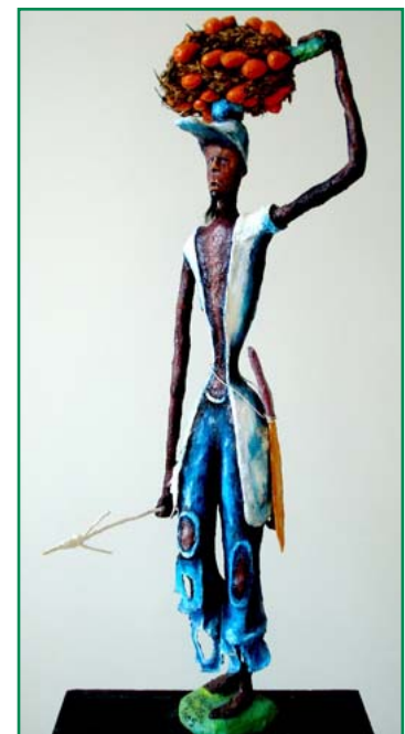
© Rhode Bath-Schéba Makoumbou, 2005. Rhode Makoumbou, Sculpteuse et Peintre congolaise disposera d'un stand au Festival Malaki Mâ Kongo à Paris. www.rhodemakoumbou.eu